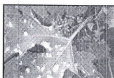
Atac de Eriophyes v.