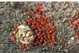
Păianjenul roșu - ouă