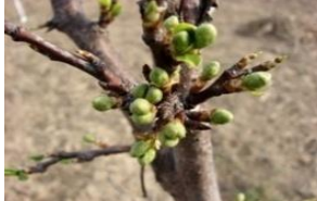
buton verde prun

Aplicarea tratamentului cu ulei horticol, după fenofazele prezentate mai sus, poate afecta lăstarii tineri. Tratamentul se va efectua în zilele cu temperaturi mai mari de 5 - 6°C, fără vânt (pentru evitarea driftului), atunci când nu există condiții de precipitații în timpul sau imediat după aplicare. Se vor utiliza aparate de stropit reglate pentru o pulverizare cât mai fină a soluției și se execută astfel încât toată suprafața pomilor să fie acoperită (îmbăiere).