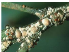
Păduchele din San Jose

AGENȚII DE DĂUNARE COMBĂTUȚI : Păduchele din San Jose ( Quadraspidiotus perniciosus ) - larve hibernante; Păianjenul roșu al pomilor ( Panonychus ulmi ) - ouă hibernante; Acarianul roșu comun ( Tetranychus urticae ); Acarianul filocoptid ( Aculus schlechtendali , A. fockeui ); Acarianul galicol al frunzelor de păr ( Eriophyes pyri ); Păduchele lănos ( Eriosoma lanigerum ); Afide ( Aphis pomi ) - ouă hibernante; Păduchele testos al prunului ( Parthenolecanium corni ); Puricele melifer ( Psylla pyri ).