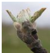
urechiușe de șoarece