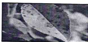
Pătarea roșie a frunzelor