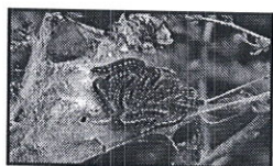
Cuib și larve ieșite din cuib

Perioada optimă de tratament: La ieșirea omizilor din cuiburi.